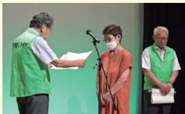
うたのつどいにて表彰式